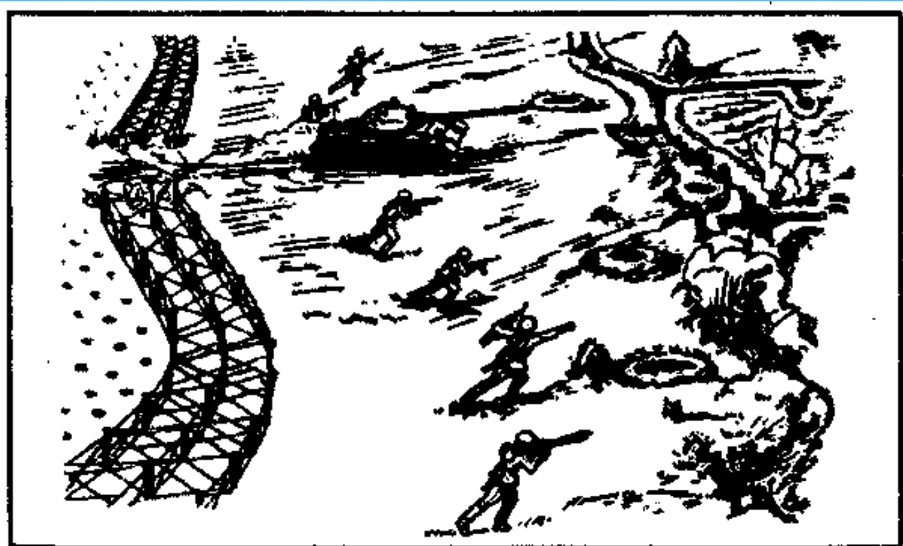
Мал. 170. Атака